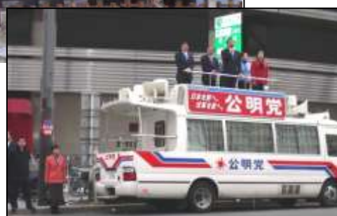
大阪府本部新春街頭演説会 北区富国生命ビル前にて